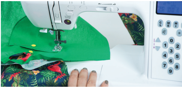
KROK 7. Przyszywamy do wewnętrznej , części tkaniny kieszonkę. Uważajcie żeby nie przyszyć do obu warstw tkaniny kieszonki.