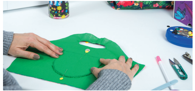
KROK 6. Następnie na wewnętrznej części śniadaniówki wyznaczamy środek, podobnie na kieszonce.