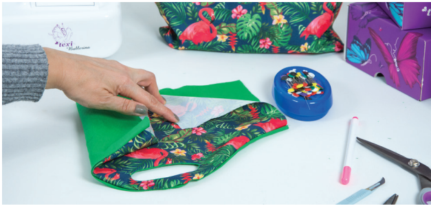
KROK 5. Wywracamy zszyte części na prawą stronę, wygładzamy szwy i prasujemy.