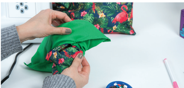
KROK 9. Składamy prawymi stronami części torebki i zszywamy je razem, zostawiając w wewnętrznej tkaninie, w spodzie torebki otwór około 8 cm niezszyty przez który wywrócimy torebkę.